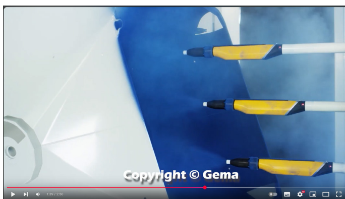
Ligne de peinture en poudre automatisée en 5 étapes