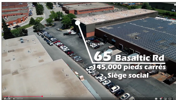
Installations de Rex

En 2023, Rex a déjà annoncé l'ouverture d'une usine de 50 000 pieds dédiée exclusivement à la production de transformateurs commerciaux standards. L'usine, située à Etobicoke, continue son plan de développement par l'installation de nouveaux équipements. Rex fabrique au Canada des transformateurs de haute qualité et conformes aux spécifications nord-américaines. Nos transformateurs monophasés ou triphasés sont en inventaire et prêts à être expédiés.